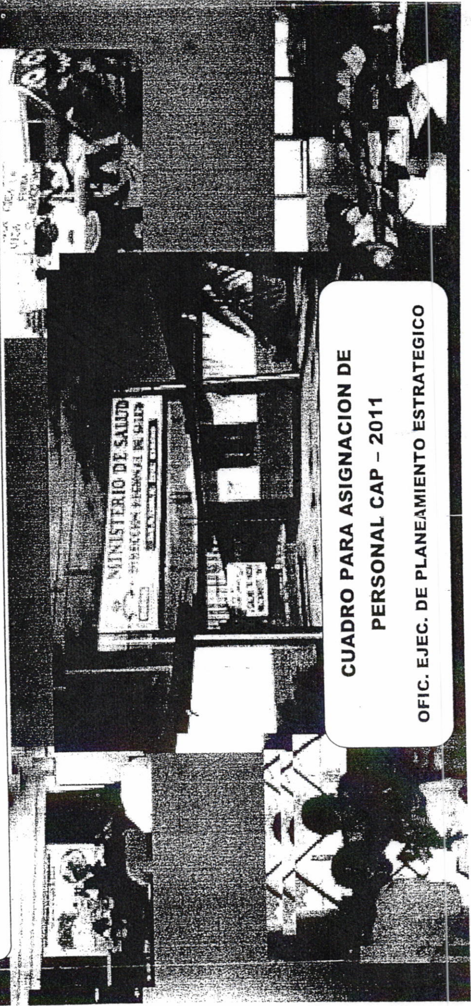
CUADRO PARA ASIGNACION DE PERSONAL CAP - 2011 OFIC. EJEC. DE PLANEAMIENTO ESTRATEGICO